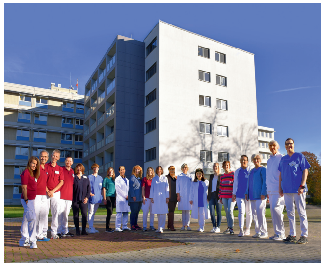
Das Team der Klinik für Geriatrie im CKU